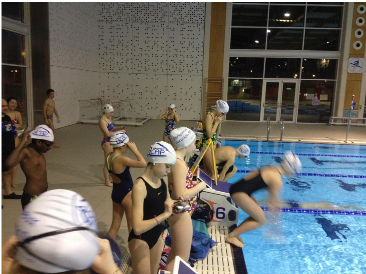
06h30 précisément : début de l'entraînement.