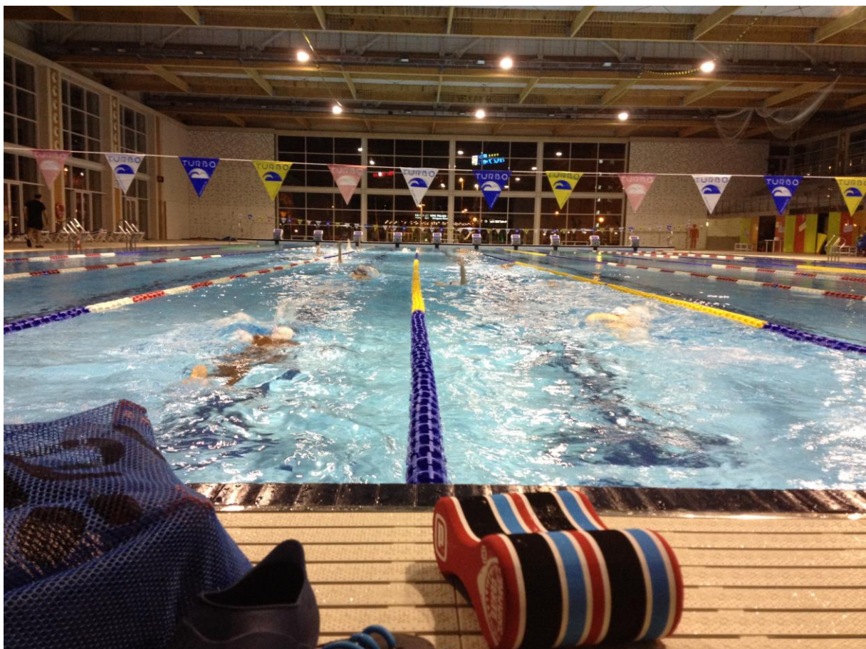
Encore 2 lignes pour les petits pour le début de l'entraînement, mais à 7h00, retour sur une seule car le public arrive à ce moment !